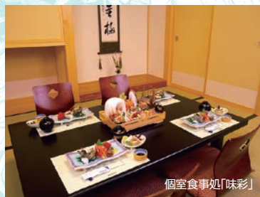
個室お食事処「味彩」