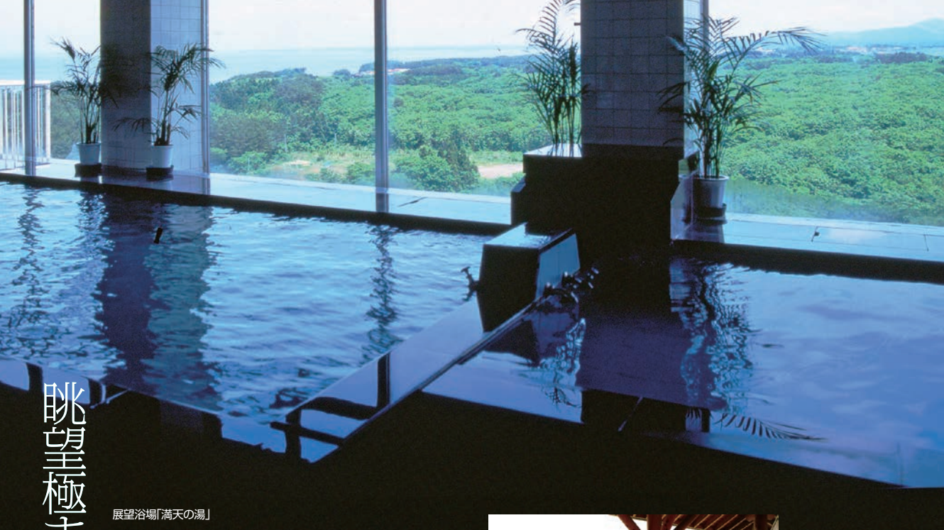
展望浴場「満天の湯」