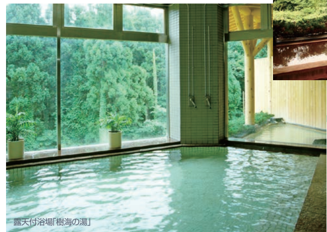
露天付浴場「樹海の湯」