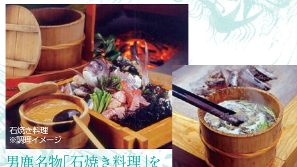
石焼き料理 ※調理イメージ